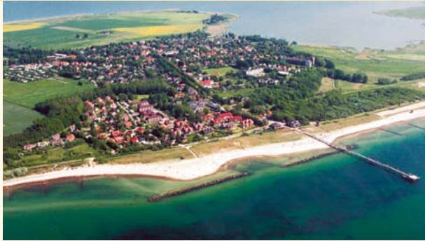
Wustrow auf der Halbinsel Fischland – Darß – Zingst

Entlang der mit Lindenbäumen gesäumten Straßen und Wege, vorbei an reetgedeckten Katen und den zahlreichen Kapitäns- und Schifferhäusern, treffen Sie auf eine große maritime Vergangenheit des Seefahrerortes.