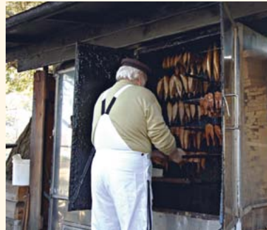
täglich frisch geräucherter Fisch