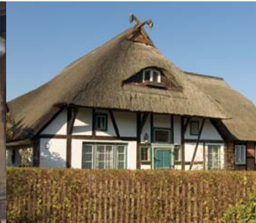
alter Brauch: Wendeknüttel

Sie erreichen uns über die A19 – Ausfahrt Rostock Ost (Nr.6) in Richtung Stralsund, Ribnitz-Damgarten abbiegen und dann der B105 folgen. In Altheide biegen Sie links ab, Richtung Prerow, Fischland/Darß und bleiben auf der Hauptstraße bis Wustrow. In Wustrow biegen Sie nach der Kirche rechts ab, Richtung Hafen; das letzte Haus auf der linken Seite ist Ihre Ferienwohnung im Haus Emily